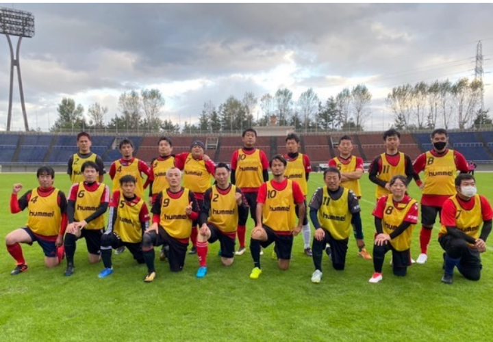
●ツエーゲン金沢OBチーム